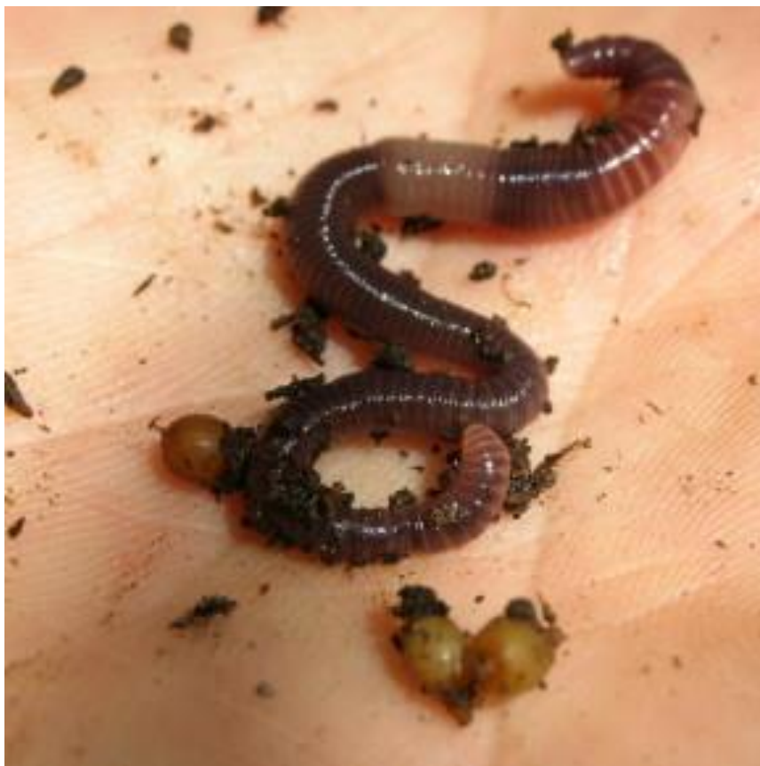
FOTO – Lombrico con uova

Non è possibile definire un quantitativo standard per quanto riguarda la concimazione del suolo. I quantitativi dipendono dalle condizioni del terreno e dalle esigenze nutrizionali della coltura. Indicativamente si potrebbe utilizzare da 1 a 2 kg di humus di lombrico per metro quadro (da 100 a 200 quintali per ettaro). Si tratta comunque di dosaggi indicativi.