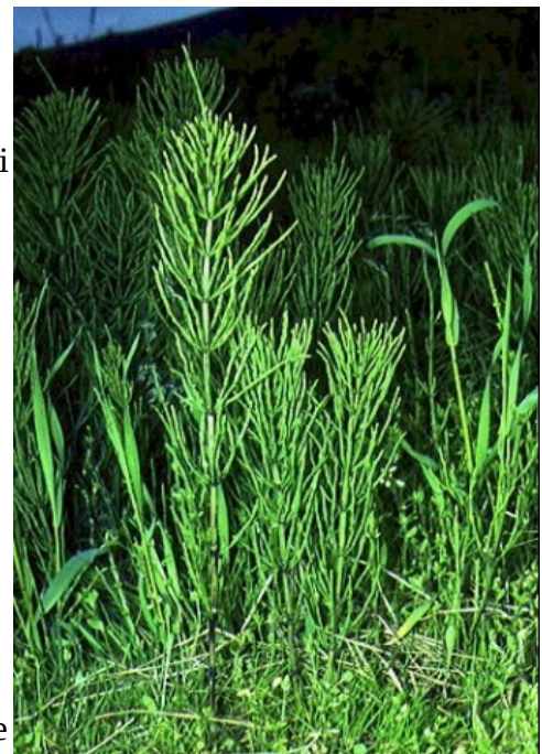
Illustrazione 4: Equisetum Arvense

Si può impiegare nelle serre, nei semenzai e in fertirrigazione per aiutare ad aumentare la resistenza delle giovani piantine; il corno silicio-equiseto lo si può usare in miscela (dopo la dinamizzazione) in rapporto 1 a 100 con altri prodotti fitosanitari biologici purché irrorati al mattino presto o alla sera tarda; nei semenzai se spruzzato sugli ortaggi da foglie (lattughe, radicchi, finocchi, ecc.) può indurre alla montata a seme precoce. Usare come preventivo, irrorando preferibilmente dopo la luna piena o dopo una pioggia. Irrorare e dinamizzare con bel tempo, pena la scarsa efficacia. Particolarmente efficace se dinamizzato con un decotto di corteccia di quercia o con il preparato biodinamico "505" sulle solanacee.