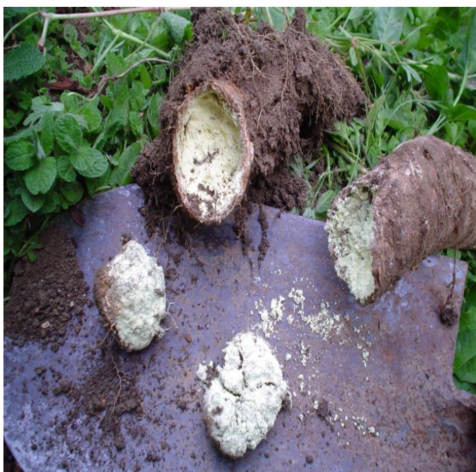
Illustrazione 1: cornosilicio-zolfo al temine della attivazione estiva

Irrorare solo se c'è bel tempo. Irrorare solo se il suolo ha ricevuto il preparato 500 o 500k almeno una volta nel ciclo vegetativo della coltura. Tenere lontano almeno 15 giorni da trattamenti di polisolfuro e poltiglia bordolese. Può essere miscelato assieme al 501 in questo caso si usa 1 gr di 501 e 2 grammi di corno silicio-zolfo.