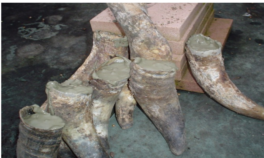
Illustrazione 3: cornoargilla in fase di allestimento