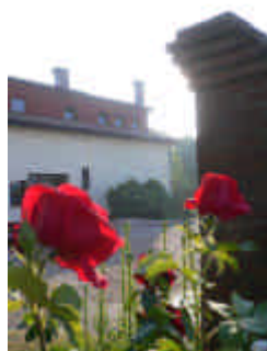
Sopra: vista Est del Centro. Di fianco particolare dell' ingresso. Sotto: Sala "Maurizio Salvini" Le foto sono di Giovanni Picariello, tutte immagini della sede.