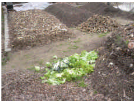
Lavoro di compostazione in Sede degli scarti organici solidi